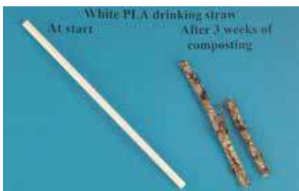
開始時と堆肥試験3週間