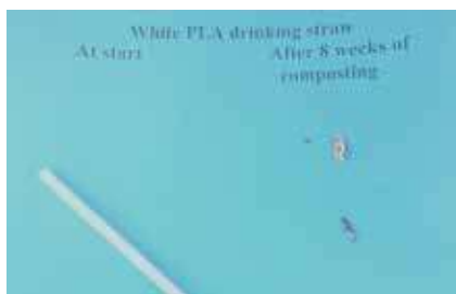
開始時と堆肥試験8週間