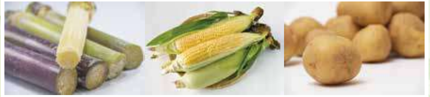
サトウキビ・トウモロコシ・じゃがいもなどの植物を原料としています。