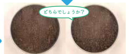
従来 堆肥試験12週間 顕微鏡でも確認できないレベルまで